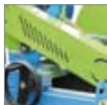
Enostavna, lahka in natančna ročna nastavitvev globine razreza.