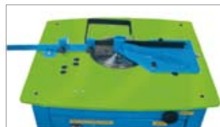
Priprava za izdelavo stremen