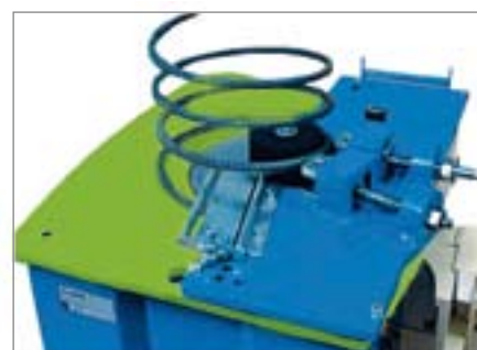
Priprava za izdelavo spiral