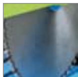
List industrijske kvalitete.