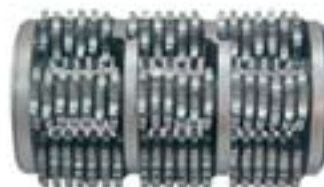
Komplet boben z rezili