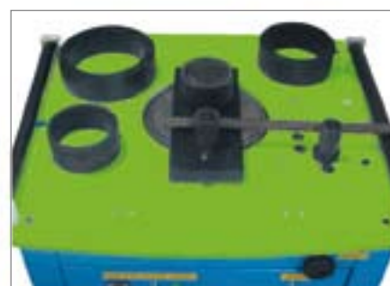
Posebni pribor po normi UNE36831