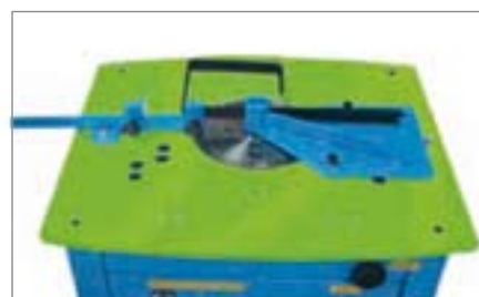
Priprava za izdelavo stremen