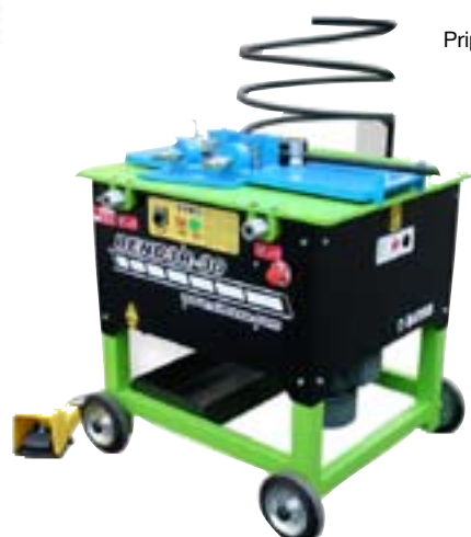
Priprava za izdelavo spiral