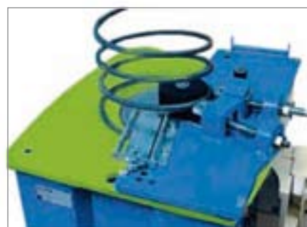
Priprava za izdelavo spiral