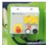
Stikalna plošča v ohišju z stopnjo zaščite IP657 in dvojno izolacijo.